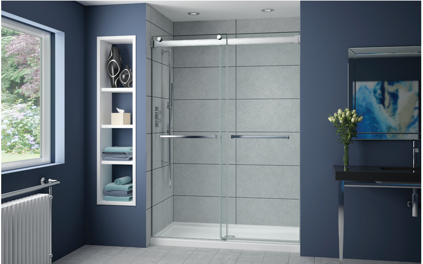
Model shown / Modèle présenté : NPS160-11-40

Bypass sliding doors / Portes coulissantes bidirectionnelles